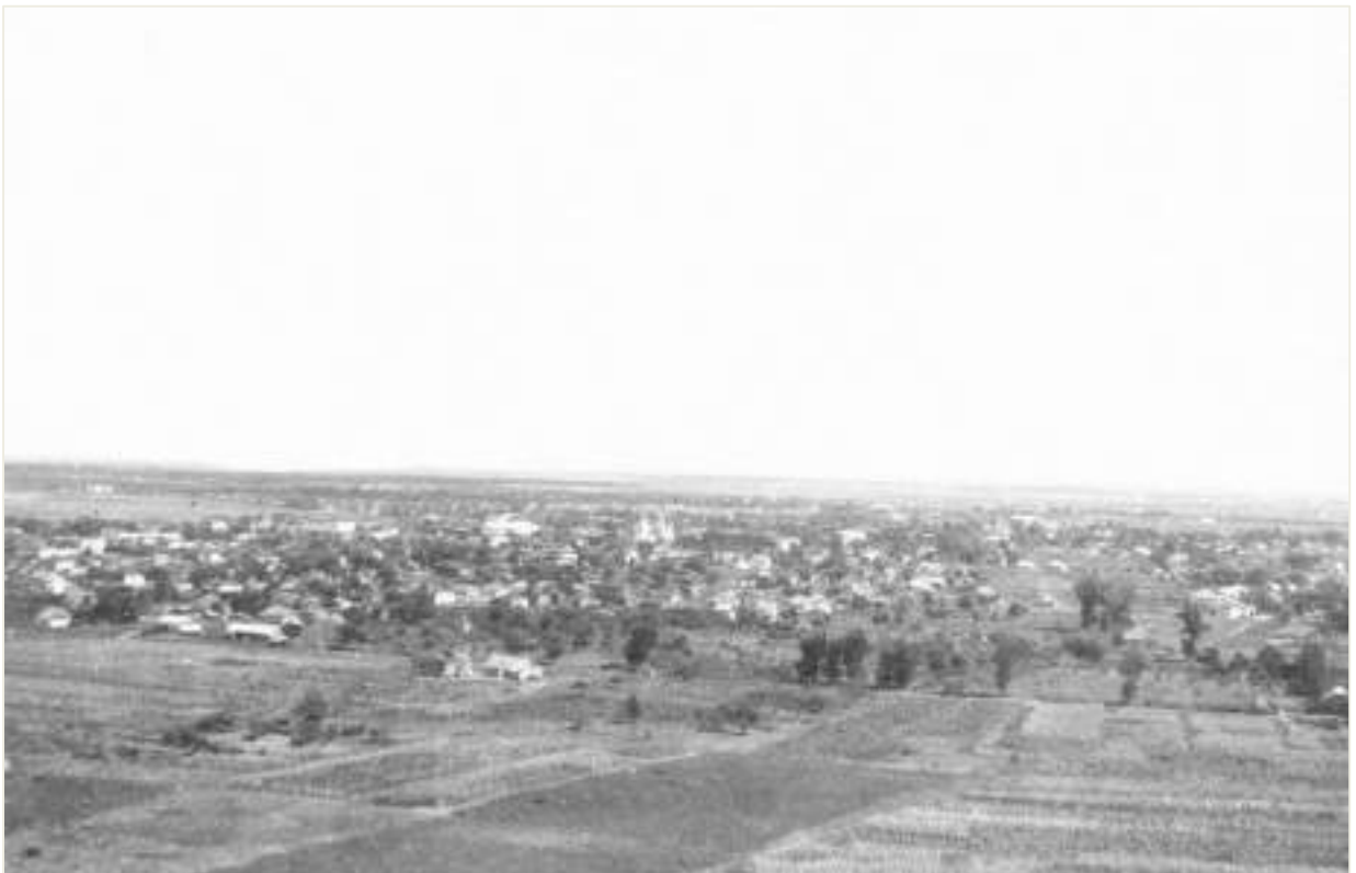
28. Панорама міста з південного заходу. Фото 1948 р.