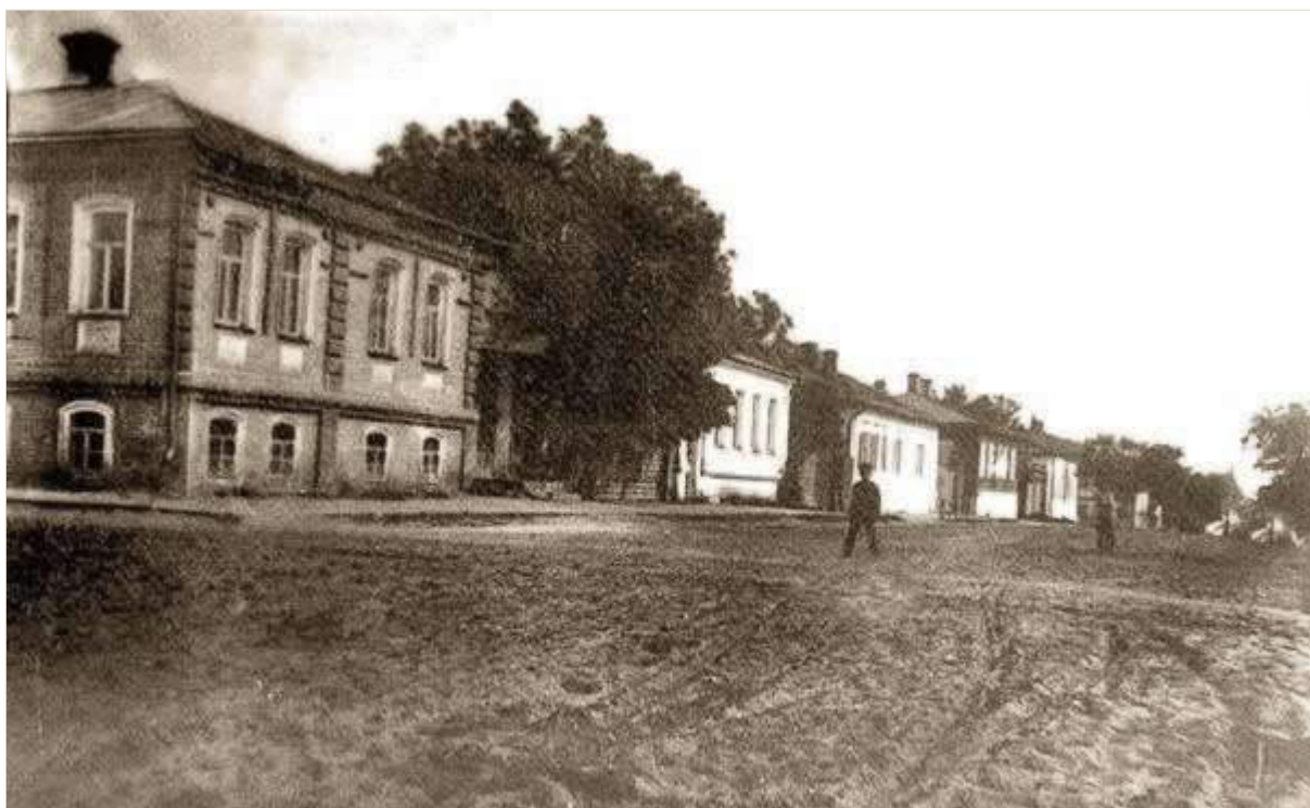
10. Будинок Дворянської концертної зали на вулиці Комерційній, сучасній Центральній, рiг Монастирської, 15. Фото поч. ХХ ст.