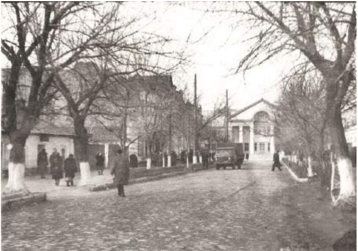
30. Будівля Палацу культури. Вид з боку вулиці Володарського, сучасної Руднева. Фото 1950-х рр.