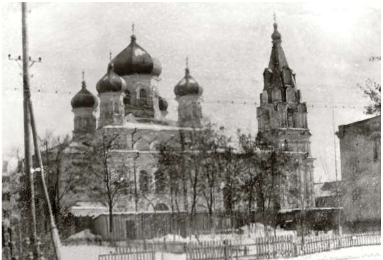
32. Миколаївський собор. Фото 1966 р.