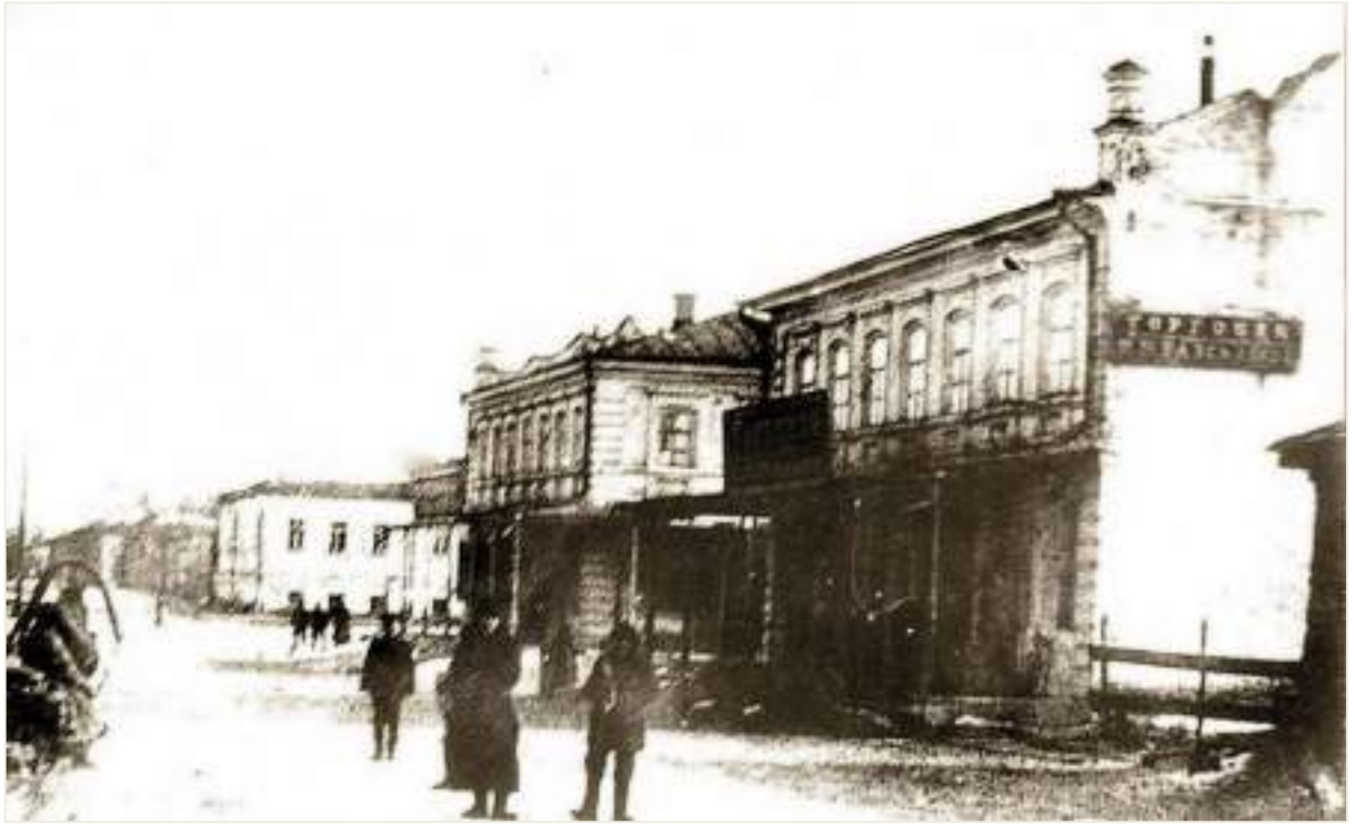
11. Вулиця Комерційна, сучасна Центральна. Фото поч. XX ст.