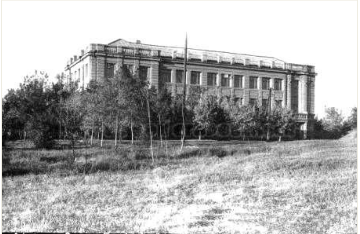
29. Будівля середньої школи № 2 по вулиці Леніна, сучасній Слобожанській. Фото 1956 р.