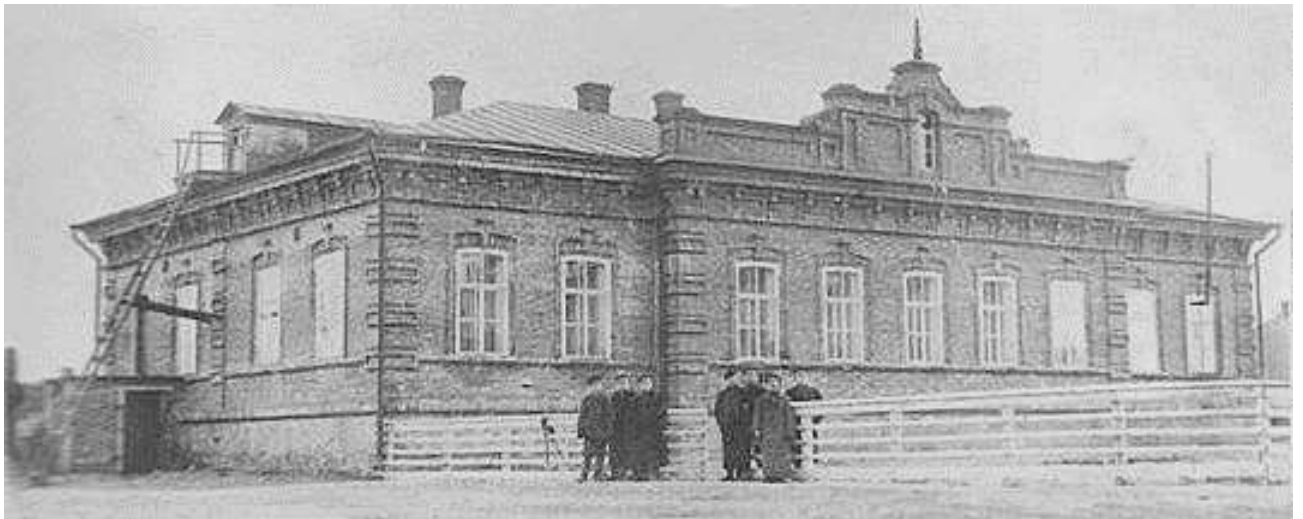
8. Гуртожиток комерційного училища на вул. Класичній, сучасній вулиці Гімназичній, 55. Нині - будинок краєзнавчого музею. Фото поч. XX ст.