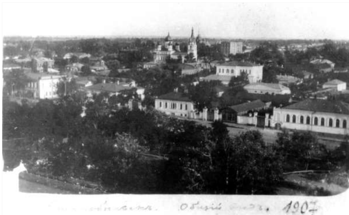
1. Загальний вигляд Старобільська з північного заходу. Фото 1907 р.