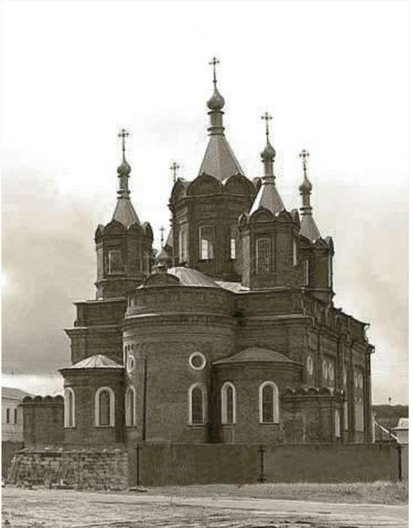
18. Літній собор Скорбященського жіночого монастиря. Фото поч. XX ст.