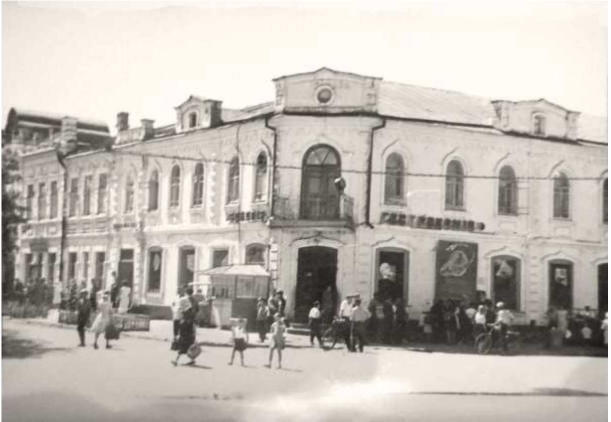
31. Колишній будинок Руднева на розі вулиць Комунарів та Володарського, сучасних Центральної та Руднева. Фото 1950-х рр.