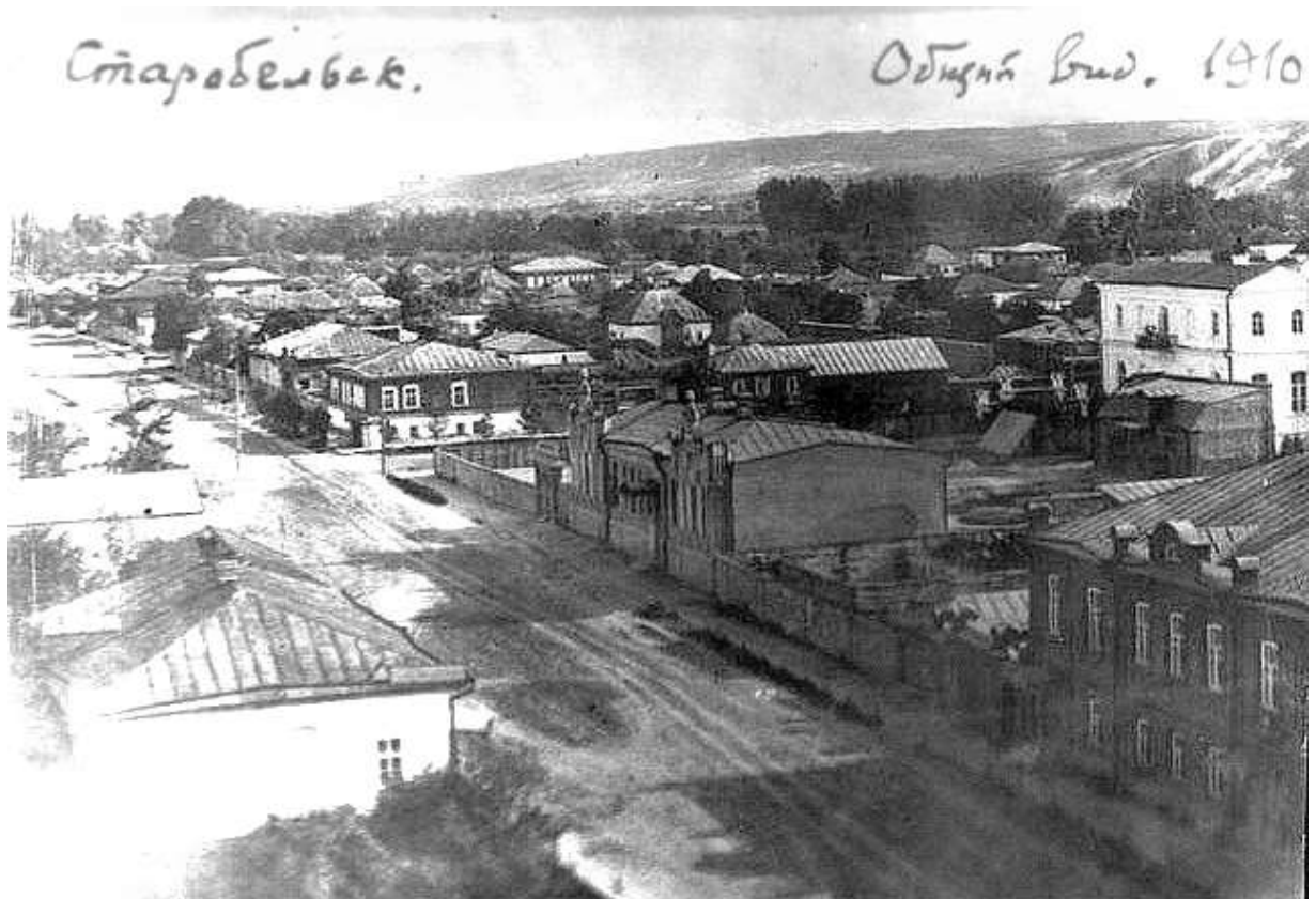
3. Загальний вигляд вулиці Айдарської з пожежної каланчі. Двоповерхова будівля праворуч – приватна школа-пансіон Кожухівська по вулиці Миколаївській, сучасній Слобожанській. Фото 1910 р.