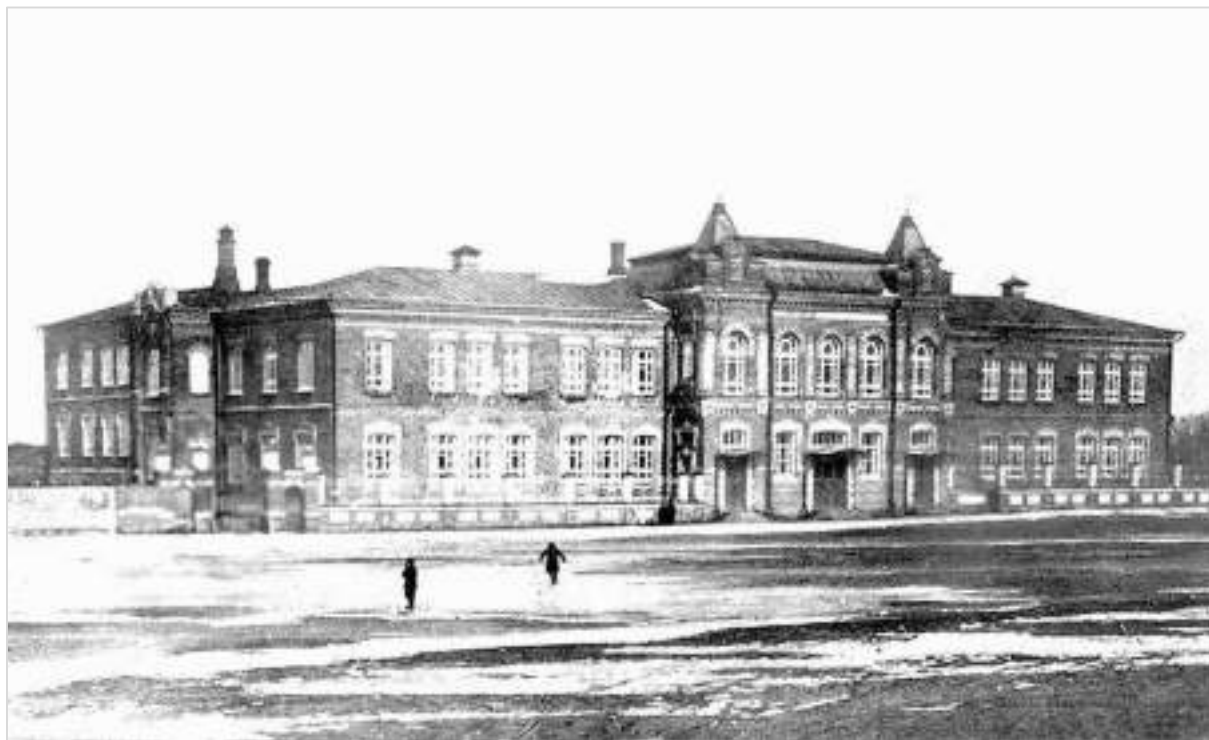
9. Катеринівська жіноча гімназія на вул. Миколаївській, сучасній площі Гоголя, 1. Фото 1910-х рр.