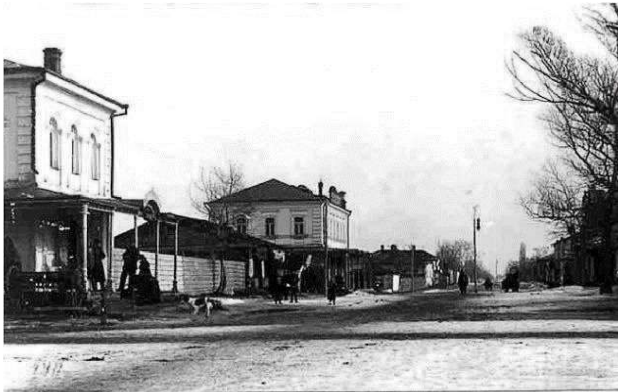
19. Вулиця Комерційна, сучасна Центральна, на передньому плані ліворуч – будівля торгових рядів Ф. Склярова. Фото поч. XX ст.