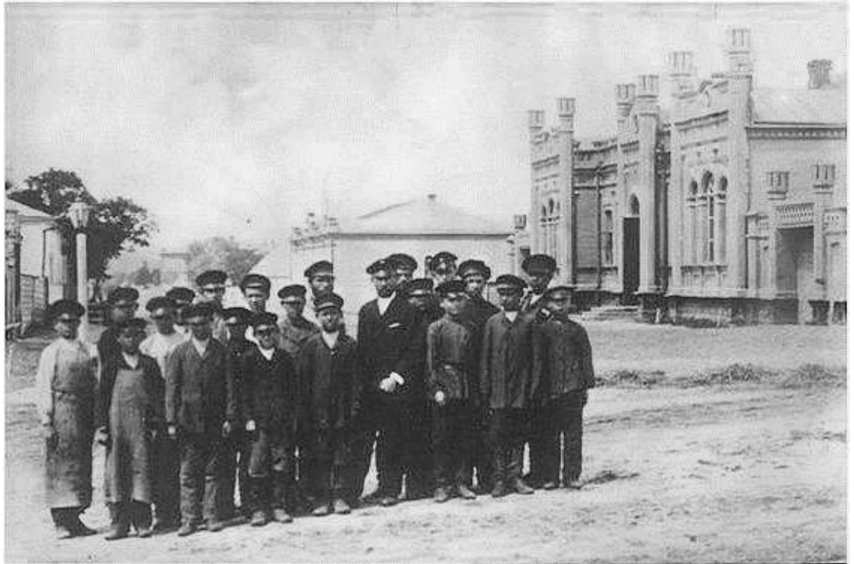
7. Вулиця Класична, сучасна Гімназична, 53. Учні ремісничого училища на фоні будинку навчального закладу. Фото поч. XX ст.