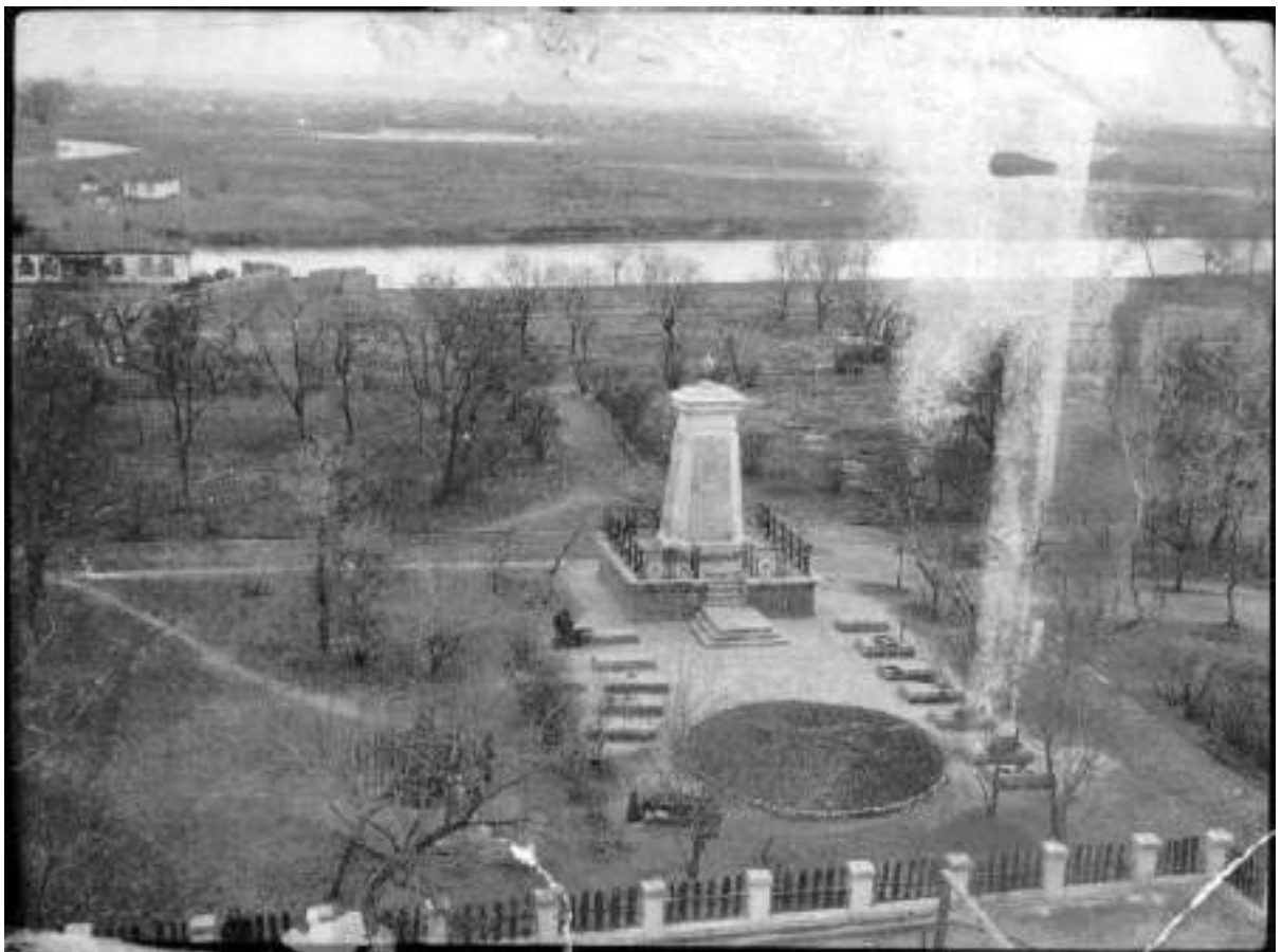
22. Пам'ятник «Борцям Революції». Виз з пожежної каланчі (фото 1930-х рр.)