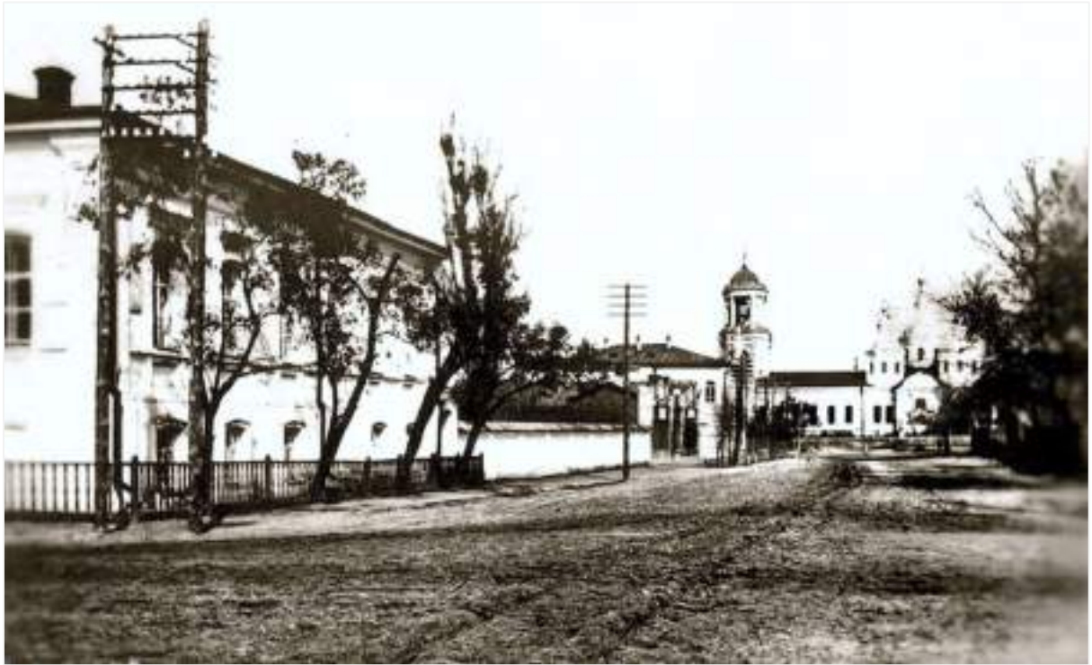
14. Вид на Покровський собор від перехрестя вулиць Старобільської та Миколаївської, сучасних вулиць Великої Садової та Слобожанської. Фото поч. XX ст.