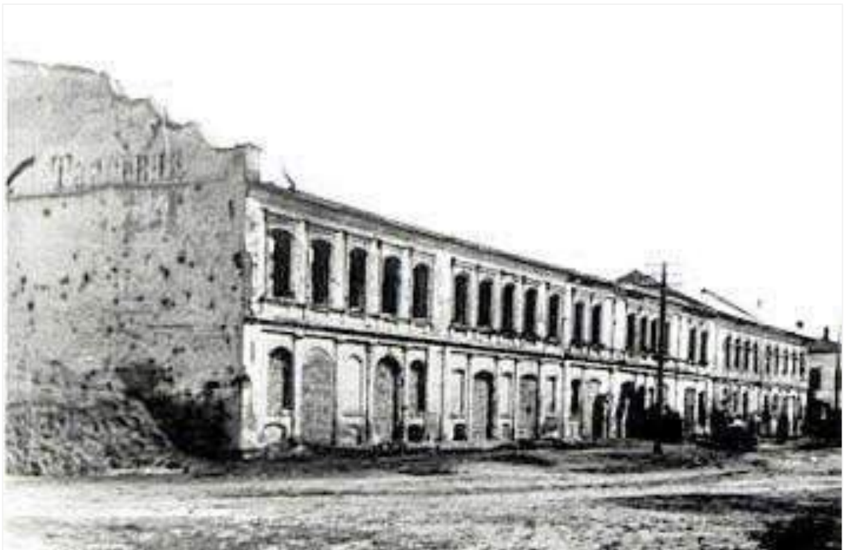
24. Напівзруйновані торгові ряди на розі вулиць Урицького та Комунарів, сучасних Світличного та Центральної. Фото II пол. 1940-х рр.