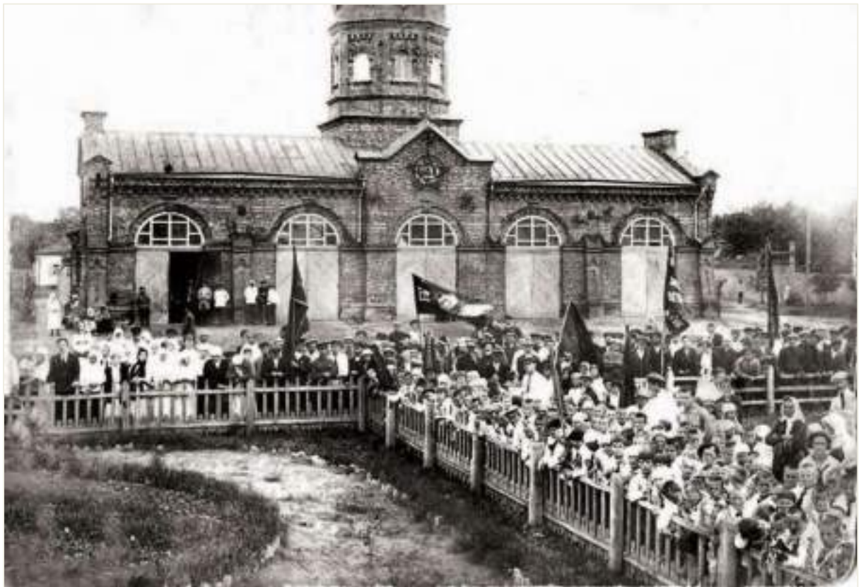
26. Будівля пожежної частини. Фото поч. 1920-х рр.