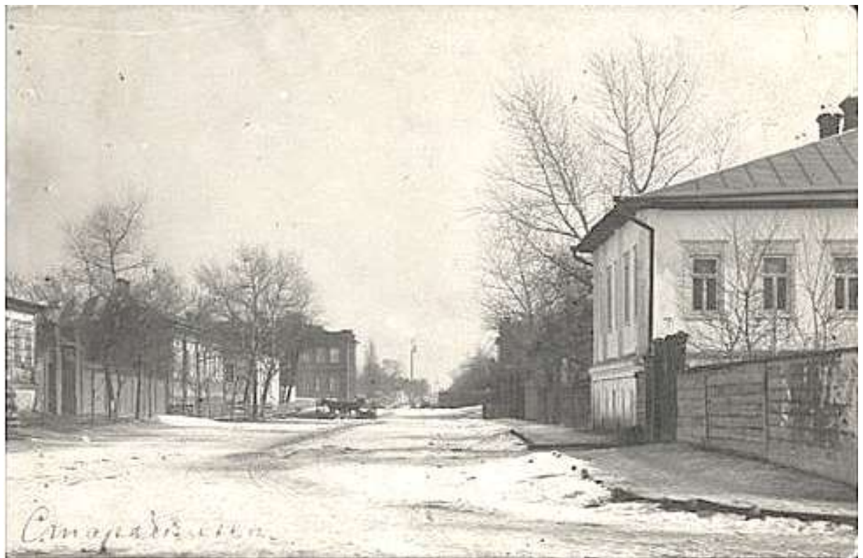
6. Вулиця Класична, сучасна Гімназична. Фото поч. XX ст.