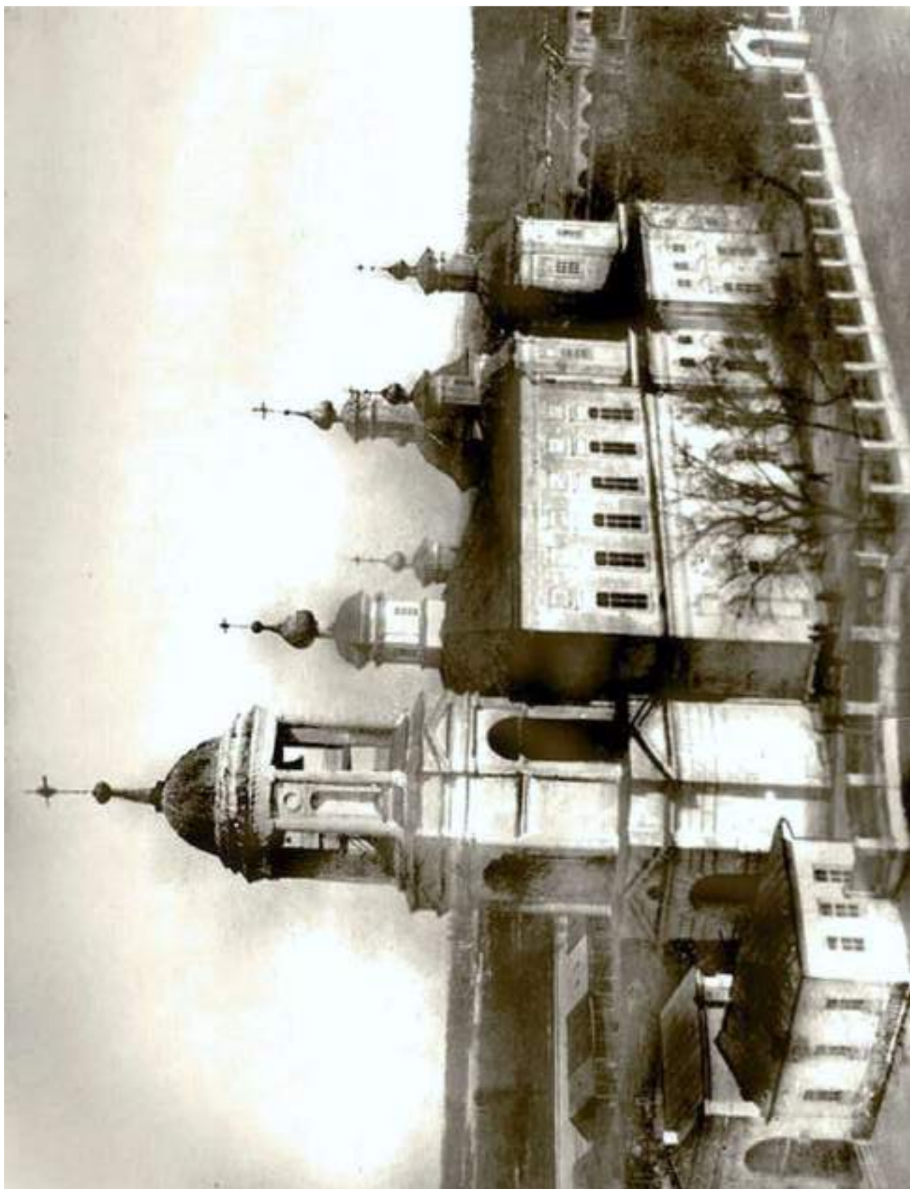
13. Покровський собор на Соборній площі. Вид з пожежної каланчі. Фото поч. XX ст. Зруйнований у 1934 р.