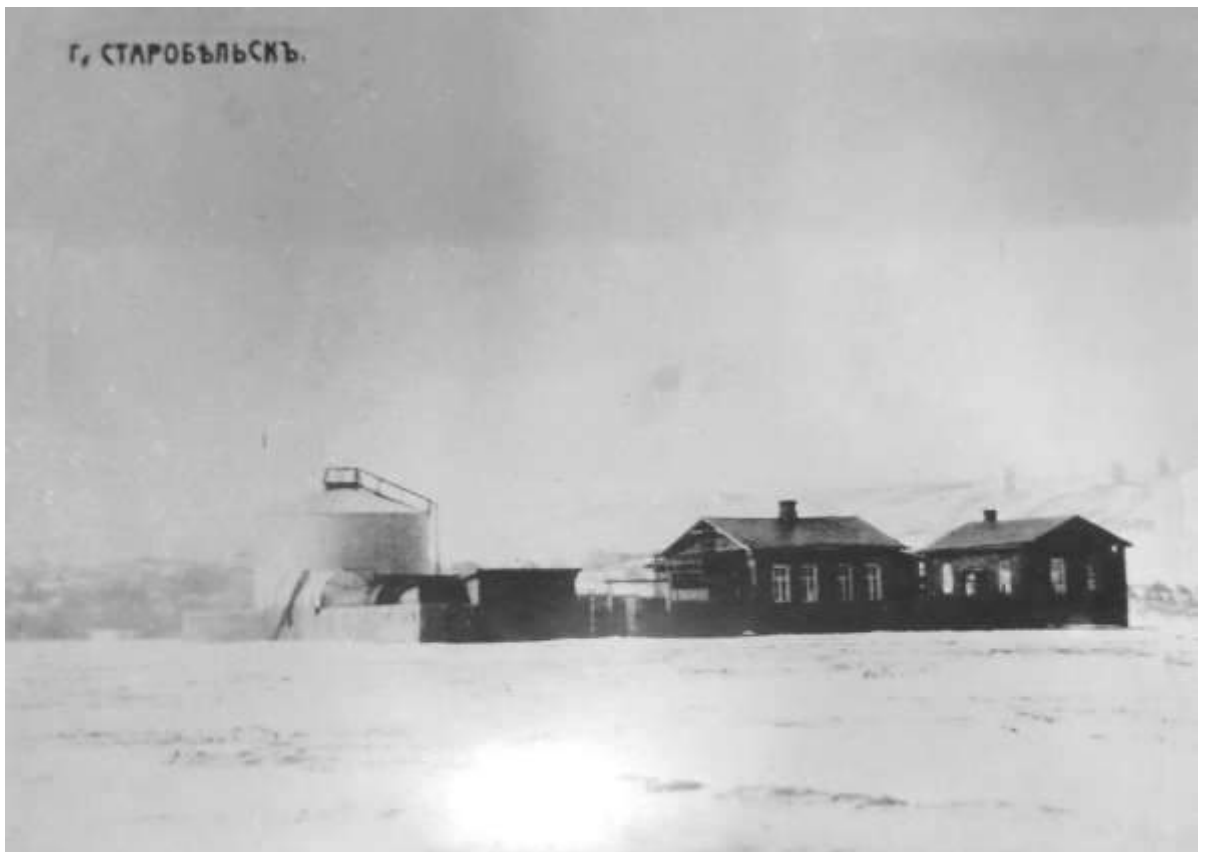
12. Крамниця товариства братів Нобель. Фото 1912 р.