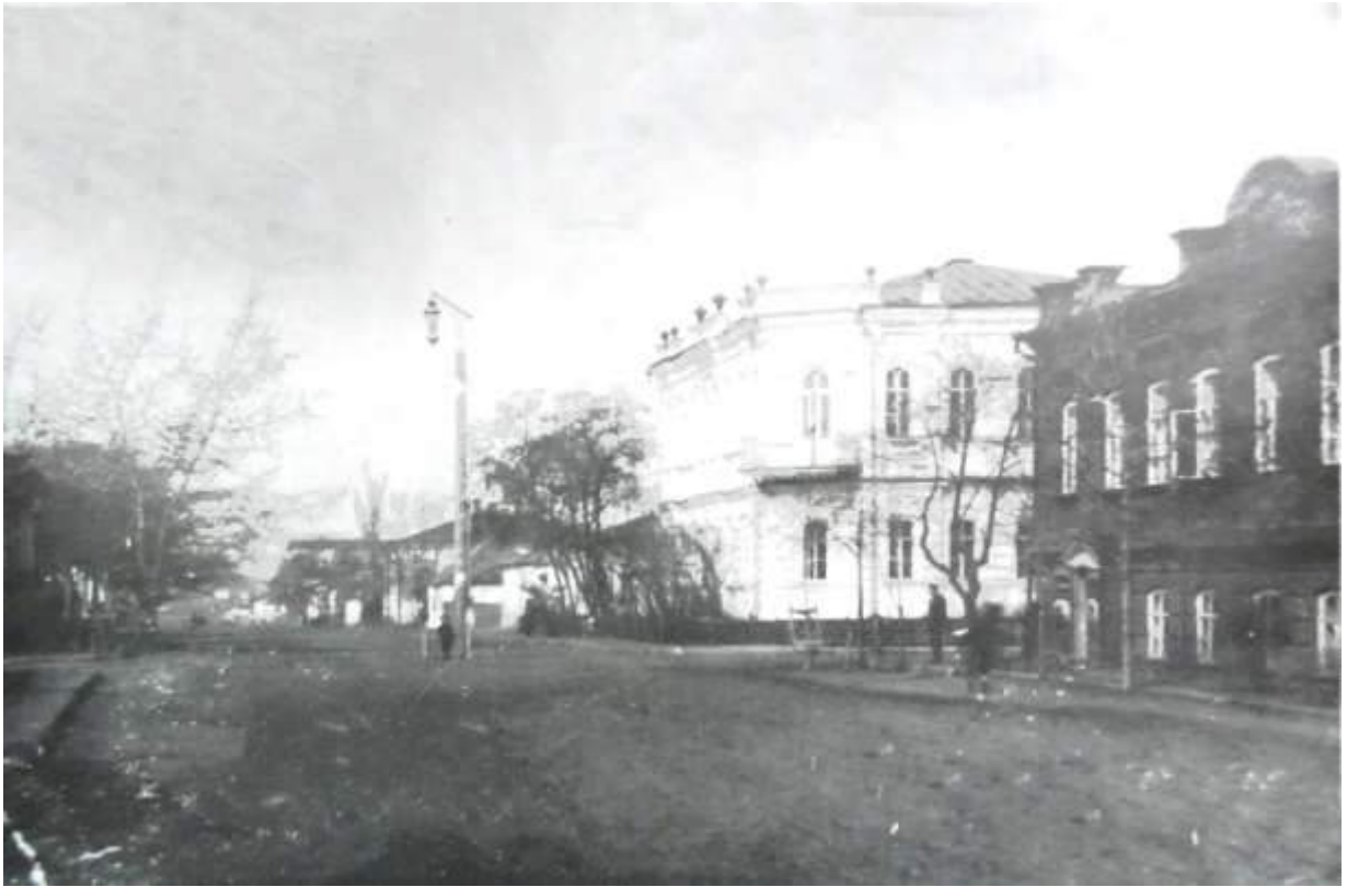
27. Будинок Ковтунова (у 1920-30-х рр. – окружкому) на розі вулиць Миколаївської та Соборної, сучасних Слобожанської та Світличного. Фото 1924 р.