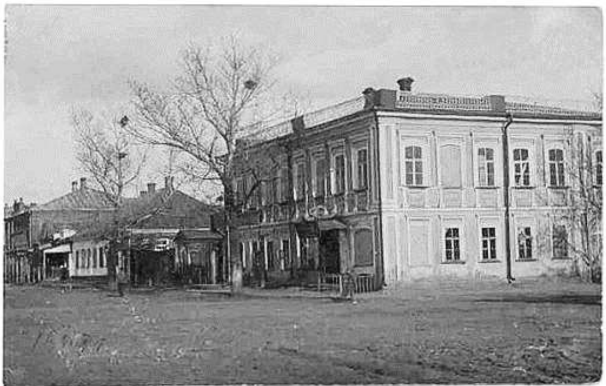
20. Магазин та пекарня Авадзяна на розі вулиць Комерційної та Соборної, сучасних Центральної та Світличного. Фото поч. XX ст.