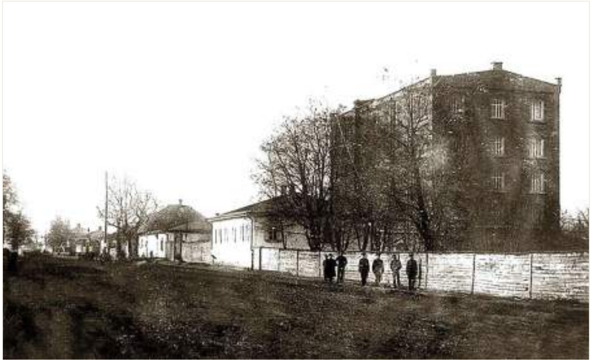
16. Будівля вальцьового млина по вул. Новій Таганрозькій, сучасній Монастирській. Фото 1910-х рр.