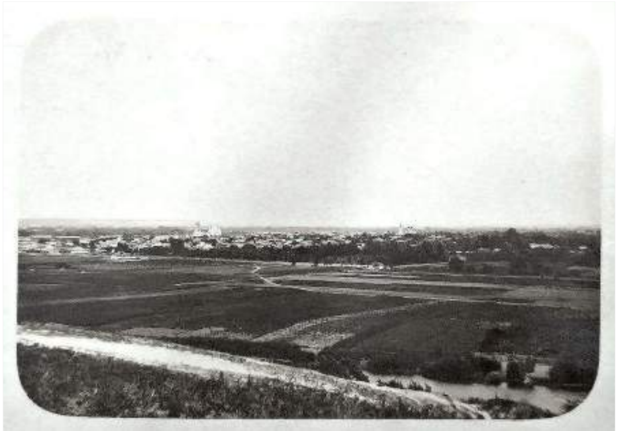
5. Загальний вигляд міста з південного заходу. Фото поч. XX ст.