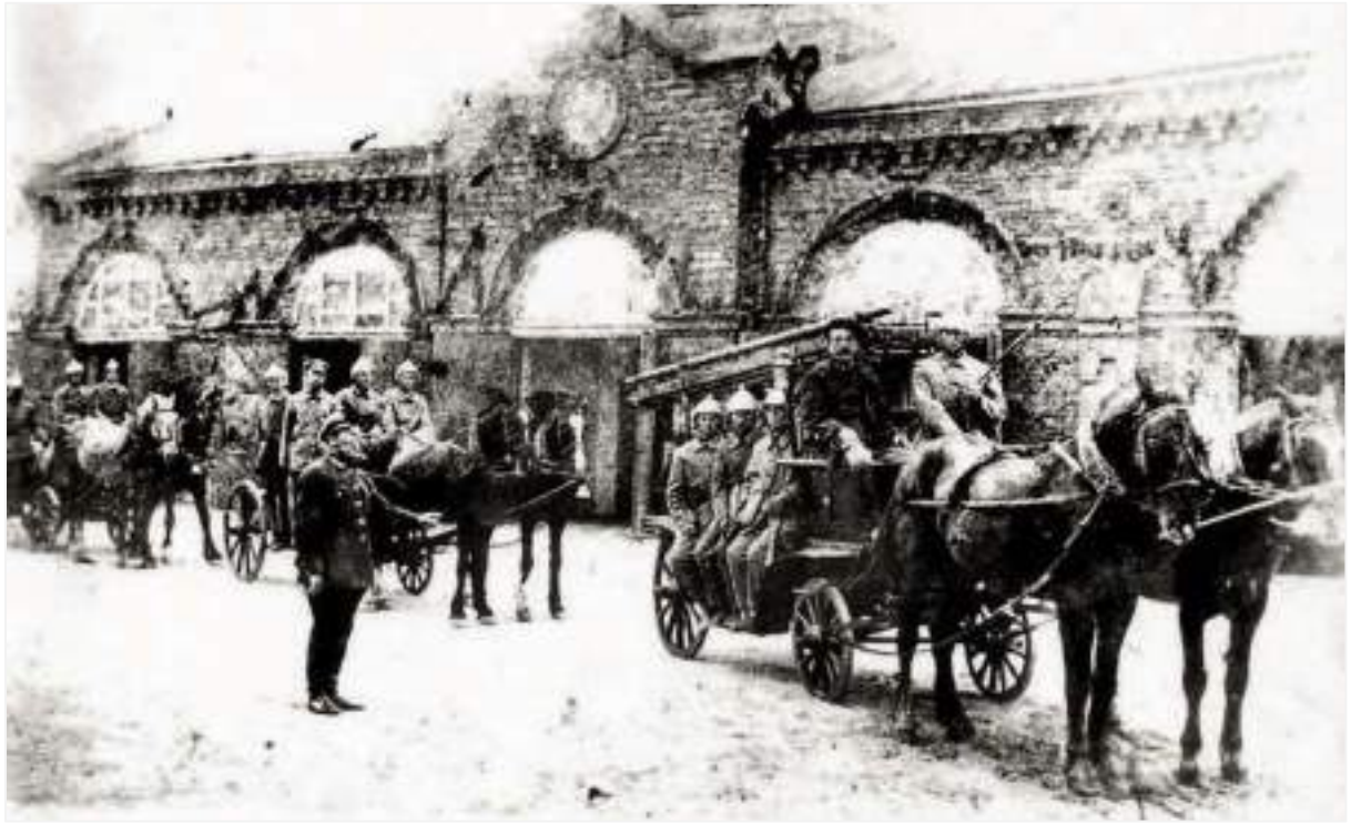
25. Будівля пожежної частини на вулиці Айдарській. Фото 1910-х рр.