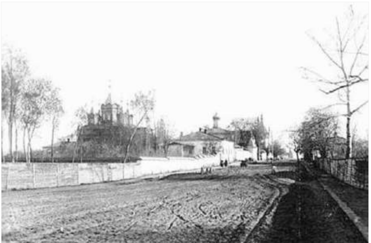
17. Вулиця Нова Таганрогська, сучасна вулиця Монастирська. Комплекс будівель Скорбященського жіночого монастиря. Фото поч. XX ст.