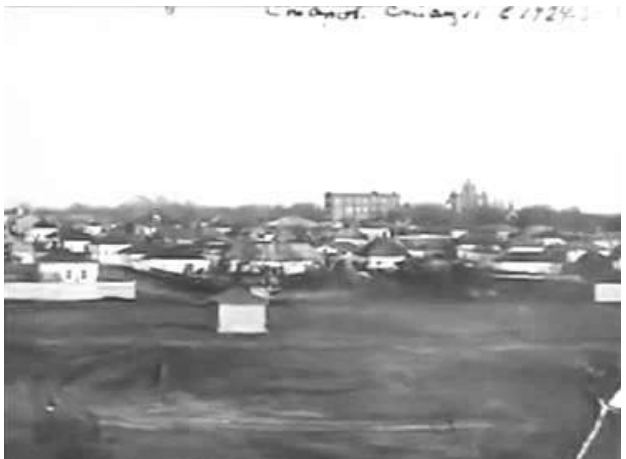
4. Загальний вигляд міста з північного заходу, з боку с. Підгорівки. Фото 1911 р.