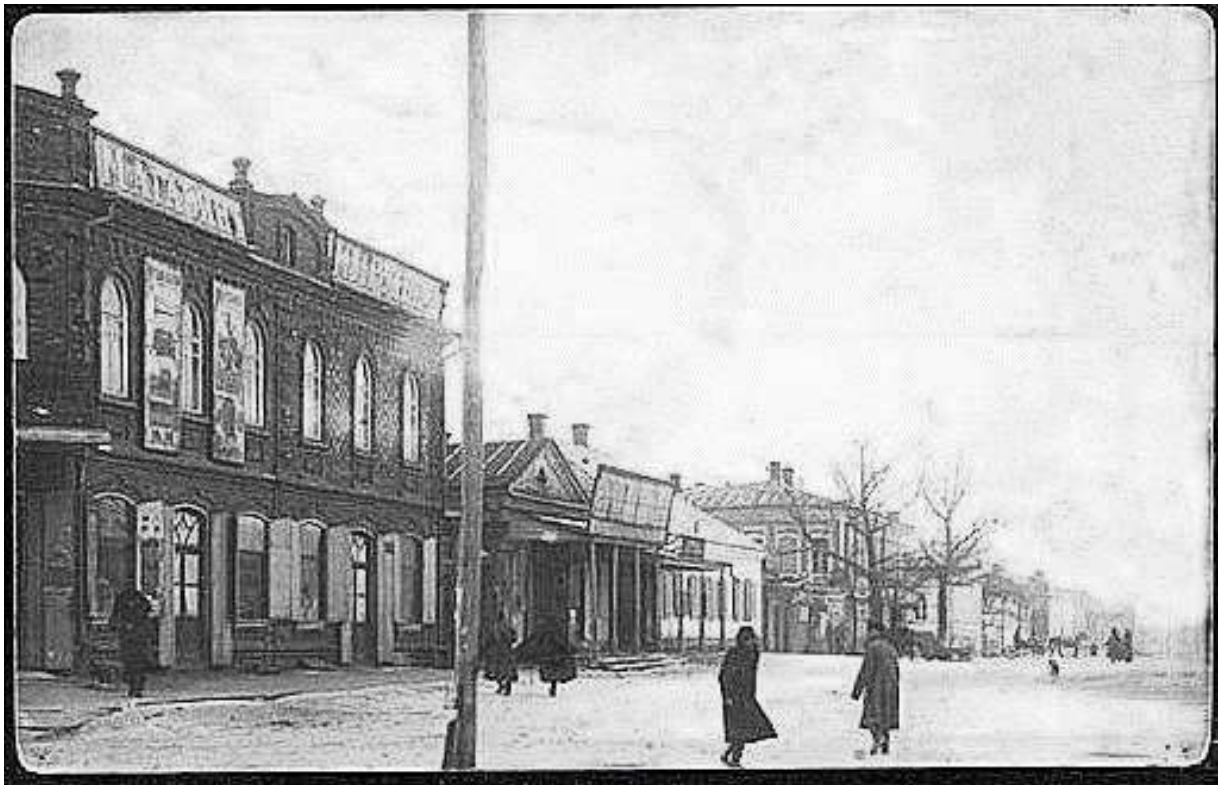
21. Магазин М. Руднева на розі Комерційної та Малої Дворянської, сучасних Центральної та Руднева, 6. Фото поч. XX ст.