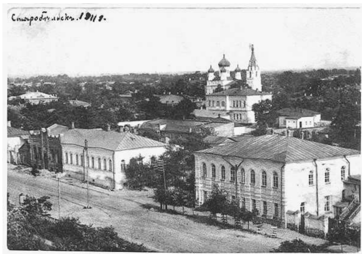
2. Будівля повітової земської управи на перетині вулиць Комерційної та Старобільської, (сучасні вулиці Центральна та Велика Садова). Вид з пожежної каланчі. Фото 1911 р.