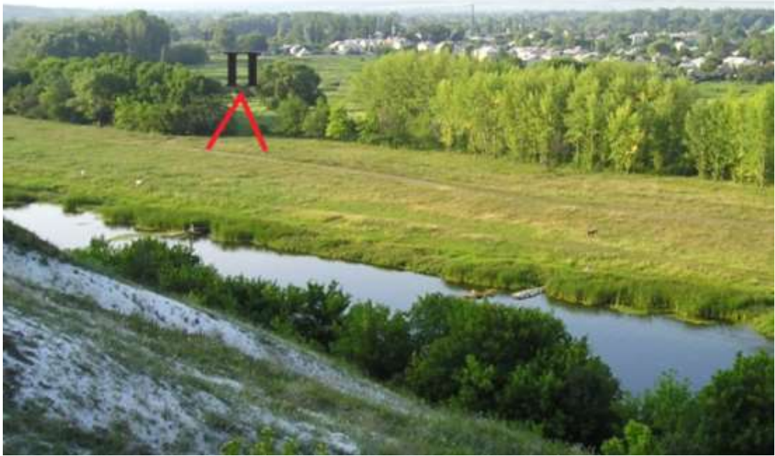
Поселення «Старобільськ-ІІ», ранній неоліт-енеоліт. Околиця міста, лівий берег р. Айдар