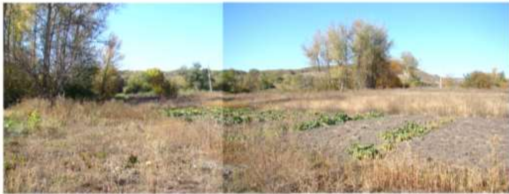
Поселення «Старобільськ-IV», пiднiй енеолiт, пiзнiя бронза. Околиця мiста, лiвий берег р. Ардар