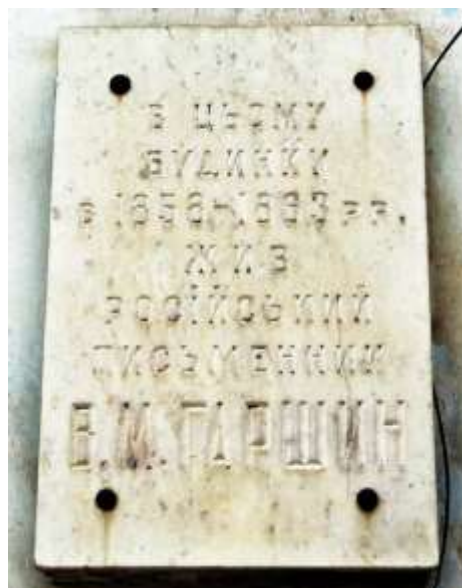
Особняк (Будинок, в якому жив Гаршин В.М., письменник, поч. ХХ ст. Слобожанської вул., 60 ріг Трудової вул.