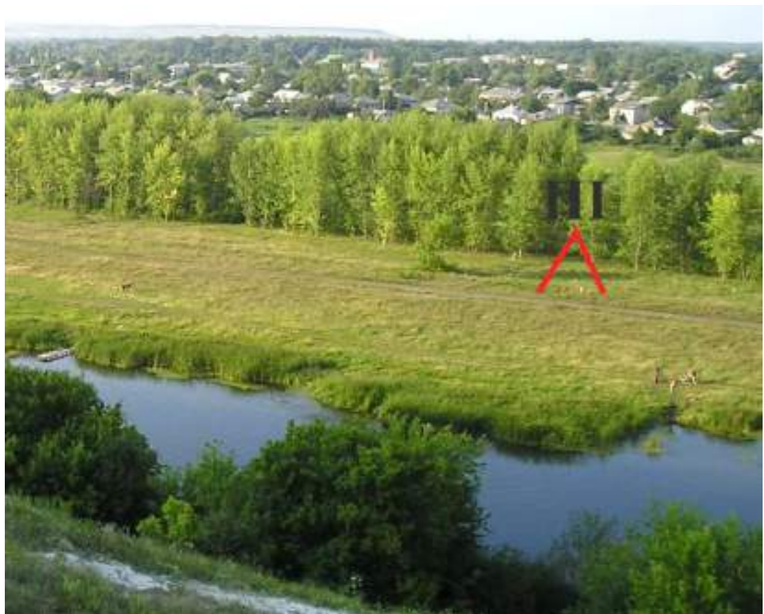
Поселення «Старобільськ-ІІІ», третя чверть V- перша чверть IV тис до н.е. Околиця міста, лівий берег р. Айдар