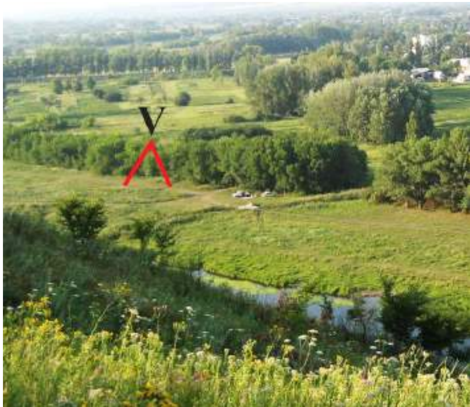
Поселення «Старобiльськ-V», раннiй неолiт-енеолiт. Околиця мiста, лiвий берег р. Айдар