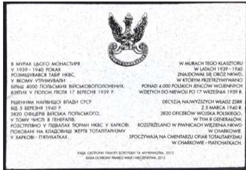
Місце розташування табору польських військовополонених, 1939 – 1941 рр. Монастирська вул., 43 (територія Скорботного жіночого монастиря)