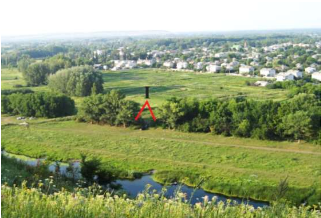
Поселення «Старобільськ-І», неоліт, середня і пізня бронза. Околиця міста, лівий берег р. Айдар