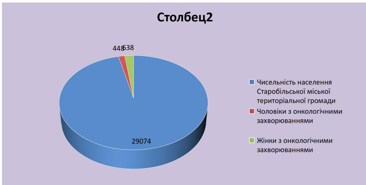
Малюнок 3. Статистичні дані онкологічних захворювань

В Старобільській міській територіальній громаді на медичному обліку станом на 01 січня 2021 перебували 1086 осіб з онкологічними захворюваннями, в тому числі 448 чоловіків та 638 жінок.